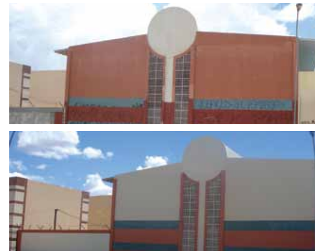
Fachada da escola antes da reforma (em cima) e o Centro Educacional após a revitalização (embaixo)